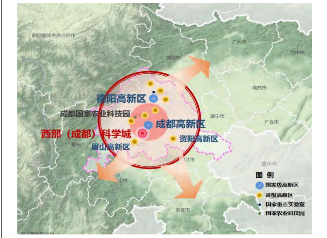
专栏3 成德眉资创新共同体空间布局图